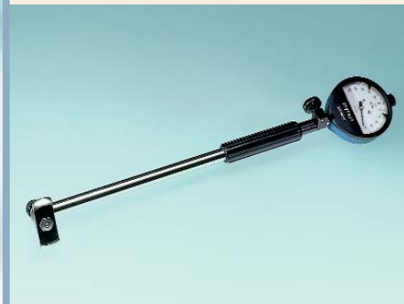
Corps de SUBITO

Livré avec : idem SU, mais corps avec coude fixe.