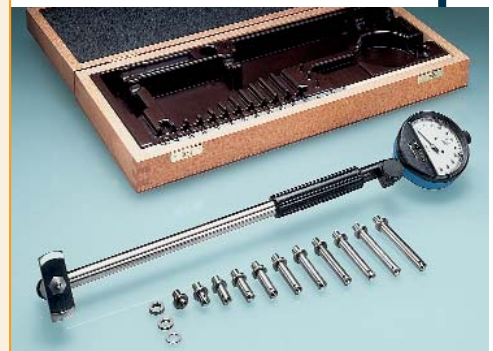
SUBITO SU 50 - 100