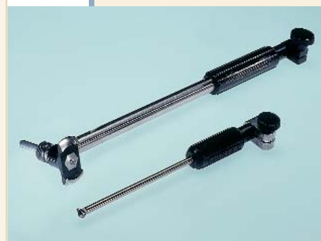
SUBITO SU 4,5 - 6 et SU 35 - 60