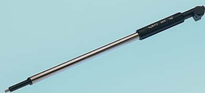
Rallonge de profondeur de mesure MTV