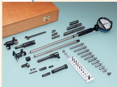
SUBITO Vario Système SVS