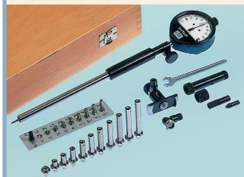
SUBITO Vario SV