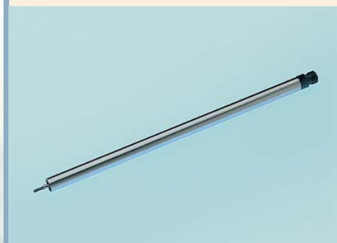
Rallonge de profondeur de mesure MTV pour SV/SVS