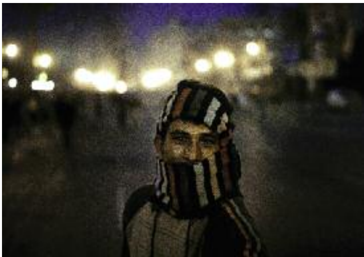
TABLE RONDE > samedi 5 novembre à 16h30

En présence > des photographes Guillaume Binet , Lionel Charrier et Julien Daniel