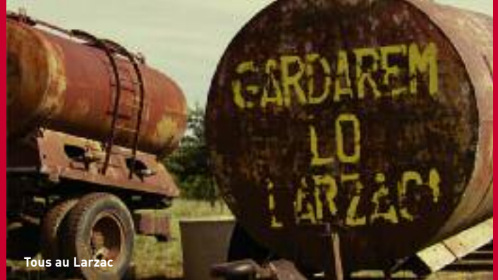
Tous au Larzac