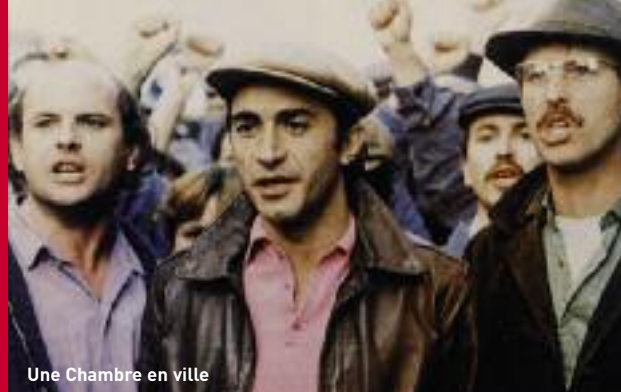
Une Chambre en ville