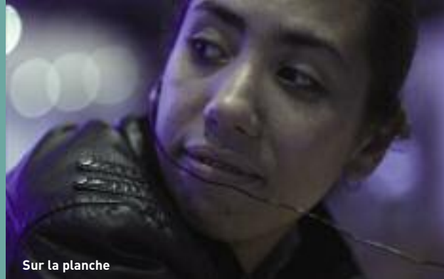
Sur la planche