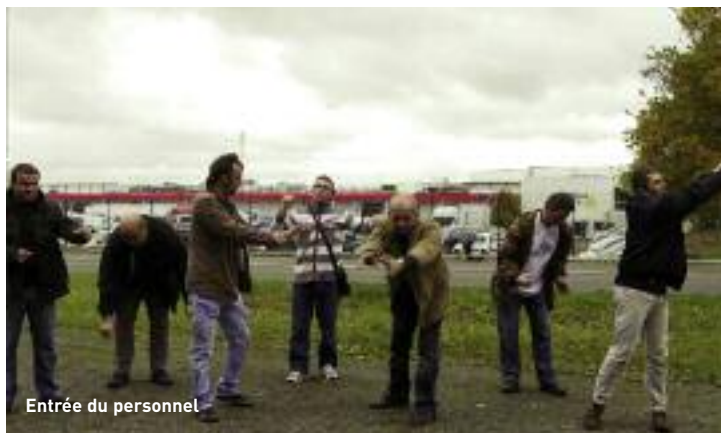
Entrée du personnel

20h30 > Autour de La classe ouvrière du littoral