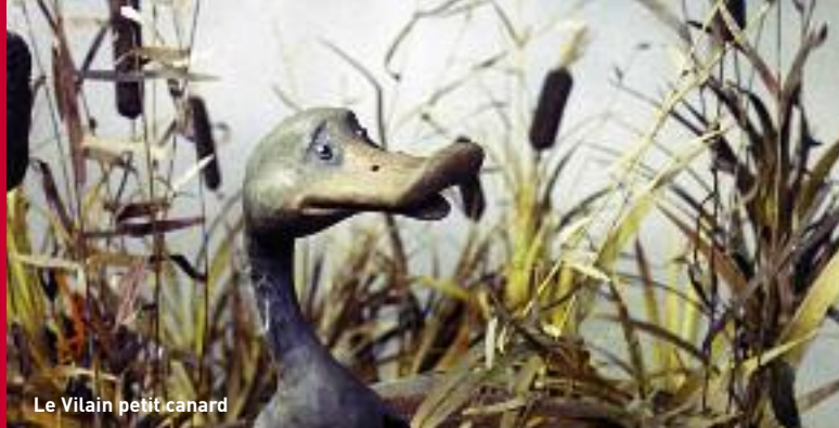
Le Vilain petit canard