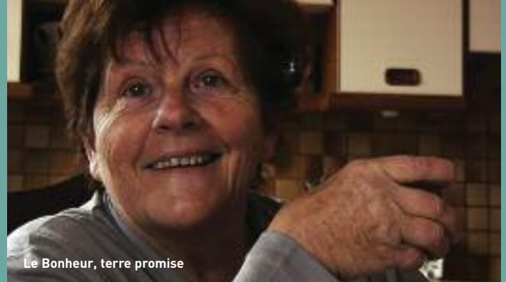
Le Bonheur, terre promise