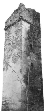
La Queue-Lez-Yvelines : tour de la Butte des Moulins : style arabisant pour l'une