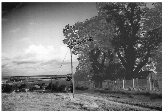
Marcq : le « Signal de Marcq » au lieu-dit « Les Châtaigniers » : site présumé d'une station Chappe toute proche de Thoiry...